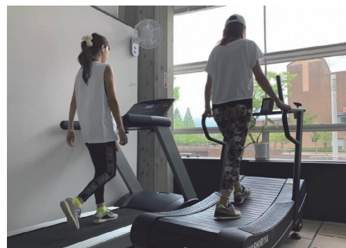
TOYAMA TOWN TREKKING SITE 電動式(左)・自走式(右) ランニングマシン