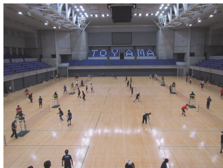
市民スポーツ・レクリエーション祭