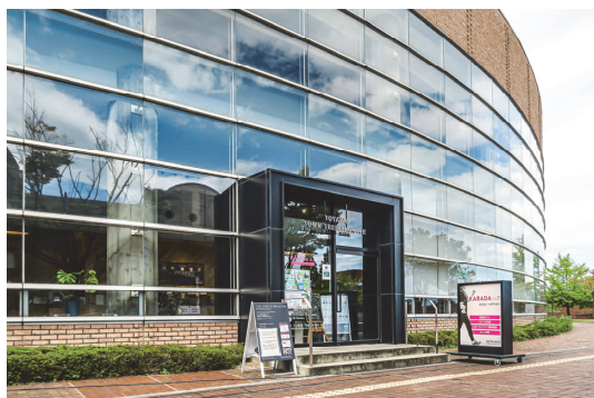
TOYAMA TOWN TREKKING SITE (富山市総合体育館内)